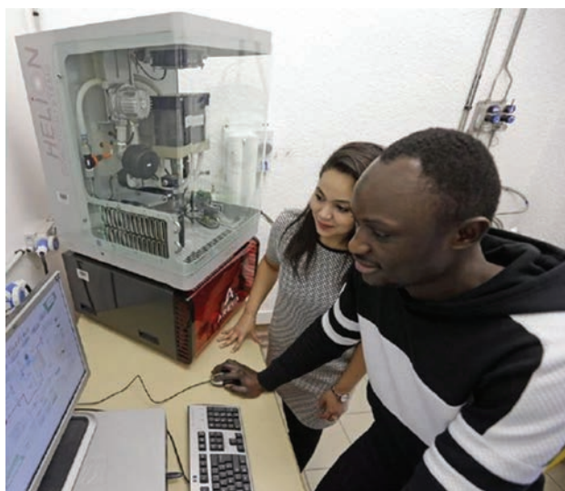
Figure 1 : Prise en main conduite dans le cadre de travaux pratiques (TP) sur les piles à combustible

À l'issue des cinq années de formation, les étudiants doivent être capables d'analyser la pertinence du recours à l'hydrogène pour diverses applications, connaître les acteurs majeurs de la chaîne de valeur associée, comparer et choisir les meilleurs moyens de produire, de stocker, de distribuer et de consommer l'hydrogène, concevoir et opérer des systèmes stationnaires et embarqués, contribuer à développer une nouvelle activité dans une entreprise ou un écosystème hydrogène, appliquer la réglementation et gérer les risques : autant de thématiques émanant de réels besoins de terrain et surtout y répondant. Les débouchés offerts par cette formation se rattachent aux secteurs de la production, de la distribution et du stockage de l'énergie, y compris renouvelable, et de l'efficacité énergétique dans l'industrie, l'habitat et les transports.