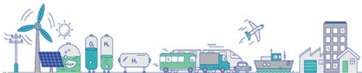
Figure 6 : La chaîne de valeur hydrogène dans l'expertise de FCLAB – Photo©Simon Daval_périples_Cie.

Les axes thématiques de ses travaux sont l'efficacité énergétique, la durabilité et la soutenabilité économique, sociétale et environnementale de la filière, de la production d'hydrogène par électrolyse, allant de son stockage à son utilisation dans des piles à combustible pour des applications transport et stationnaires (voir la Figure 6 ci-après).