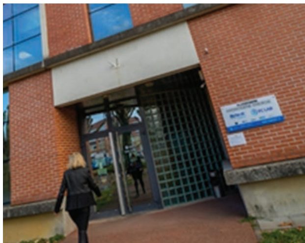
Figure 5 : L'entrée de l'UAR CNRS FCLAB

FCLAB (Fuel Cell LAB) est une unité d'appui et de recherche du CNRS, de l'Université de Franche-Comté, de l'Université de technologie de Belfort-Montbéliard et de Sup MicroMécanique. Elle est le fruit de plus de deux décennies de recherche et de développements technologiques sur les systèmes Hydrogène pour l'énergie à Belfort. FCLAB développe une offre de prestations s'adressant aux acteurs du domaine, allant de l'expertise de projets à la réalisation de campagnes d'essais et de formation continue. Elle assure ainsi un continuum recherche-valorisation, en s'appuyant sur l'expertise de ses équipes et sur l'animation scientifique du réseau se composant de ses laboratoires partenaires.