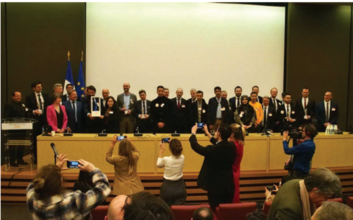
Figure 4 : Les étudiants du CMI H3E lors de la cérémonie de remise du trophée Hydrogénies 2022, organisée à l'Assemblée nationale le 15 mars 2022