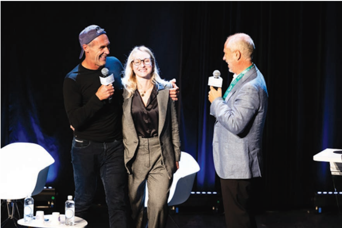
Figure 3 : Intervention d'une étudiante en CMI H3E aux côtés de Mike Horn lors du forum Hydrogen Business for Climate, à Belfort en 2021 – Photo@Véhicule du Futur – Forum Hydrogen Business for Climate.