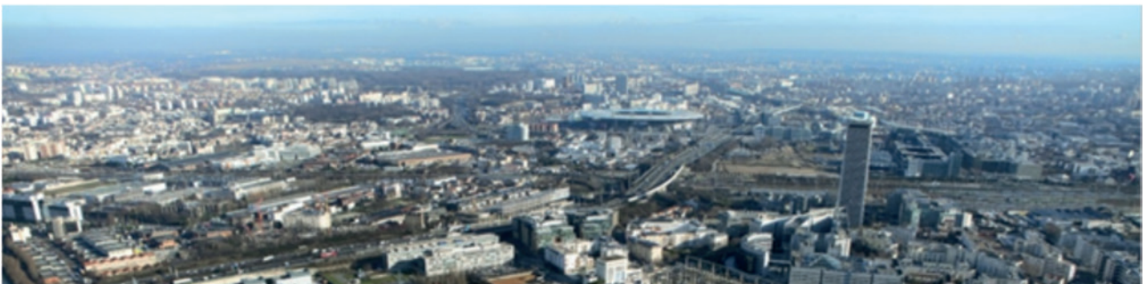
Vue générale de Plaine Commune (Seine-Saint-Denis) (à droite, la Tour Pleyel et, au centre, le stade de France).

Pour une durée de cinq ans, « Rêve de scènes urbaines » bénéficiera du soutien de l'État, à la suite de l'appel à projets « Démonstrateurs industriels pour la ville durable », dont il a été lauréat en mars 2016. L'État accompagnera la démarche pour faciliter l'innovation, notamment sur les aspects méthodologiques et les questions réglementaires en matière d'urbanisme et d'environnement.