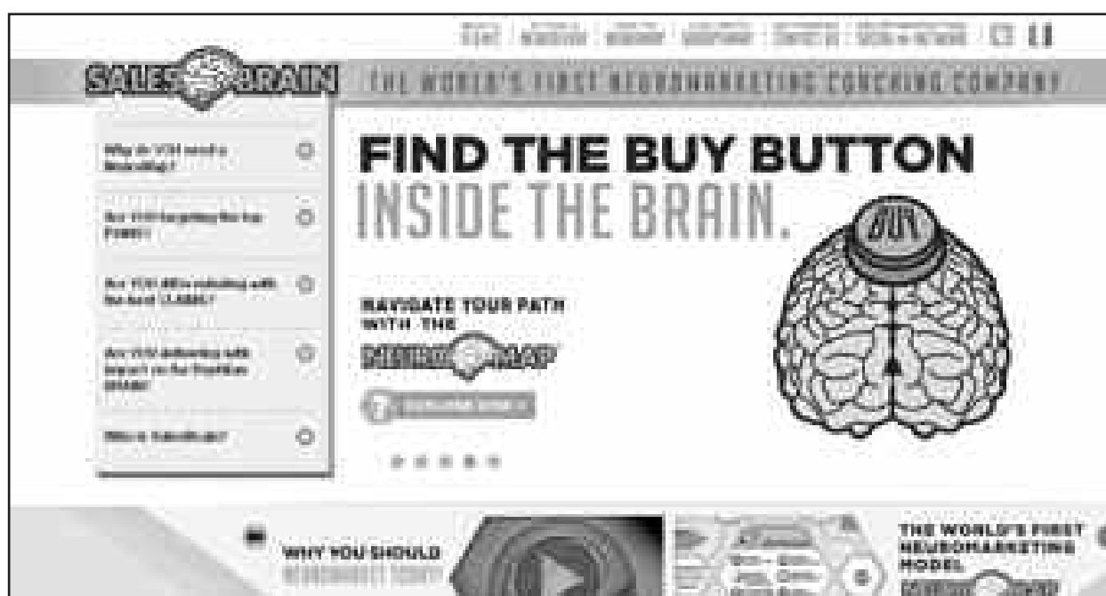
Le site de Sales Brain.

d'ailleurs Prix Nobel. Neurofocus propose six types de tests : Brands, Products, Advertising, Packaging, In-store marketing et Entertainment . Selon Neurofocus, « étant donné que les cerveaux humains sont remarquablement semblables, un projet de recherche de neuromarketing complet et scientifiquement fiable comme ceux menés par NeuroFocus ne nécessite que 10 % des personnes nécessaires à une étude classique. Donc, un projet de neuromarketing peut tester vingt participants pré-qualifiés et fournir des résultats aussi fiables, statistiquement, qu'une étude devant atteindre au moins deux cents personnes ». J'ai pu m'entretenir