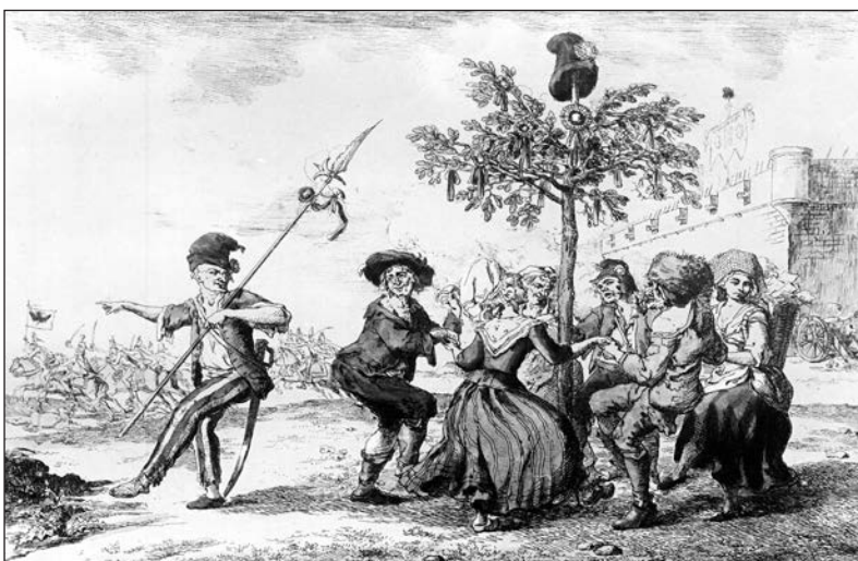
À partir de 1850, l'immigration française au Québec amène surtout des opposants à la révolution française, notamment des religieux, qui ne représentent pas la France moderne et viennent renforcer au Canada le sentiment que la mère patrie se meurt d'une révolution athée.

un Québec traditionnel de plus en plus anglicisé, voire américanisé (6). Les relations sont difficiles d'abord parce que, de 1760 à 1850, les bateaux français ne peuvent entrer au Canada, ce qui limite les contacts entre les deux pays. Le peu de Français qui viendra empruntera la voie de Londres et de New York. Puis, parce qu'à partir de 1850, l'immigration