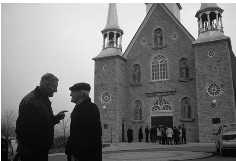
C'est dans les situations d'interaction verbale soutenue que le malaise se transforme en hostilité.

Il est fort possible d'y travailler dans une entreprise de sa culture et de ne fréquenter que des amis, des commerces et des restaurants français. Saire [1994] a noté la même stratégie, qu'il appelle la niche culturelle, et elle semblait la plus répandue à l'époque parmi ses informateurs. Notons que la majorité d'entre eux ne travaillaient pas dans des organisations québécoises francophones.