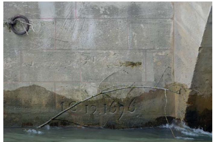
Figure 1 : Repère de l'inondation de 1696 gravé sur un éperon du Pont Royal à Paris.

La recherche dans les archives montre aussi que plus de 40 % des inondations survenues dans la capitale depuis le XVI e siècle se sont produites entre avril et septembre. Là encore, la base de données historiques du ministère de l'Écologie ne recense que 6 événements de ce type (juin 1613, juin 1697, mai 1836, mai-juin 1856, septembre 1866 et juillet 2000), alors que l'étude approfondie des archives primaires en répertorie 33. Ces données récentes revêtent donc une importance stratégique, tant en termes d'estimation des périodes de retour et de saisonnalité des inondations que de culture du risque dans une région où la spéculation immobilière est très forte. La fréquence historique des inondations de printemps et d'été pourraient aussi être prise en compte dans la perspective des futurs Jeux Olympiques qui se tiendront à Paris à l'été 2024. Elle doit également interpeller le décideur politique lorsque, malgré les récentes inondations de juin 2016 et janvier 2018, des élus promeuvent un « retour à la rivière » pour installer de nouvelles zones récréatives, commerciales et artisanales, voire même des marinas fluviales.