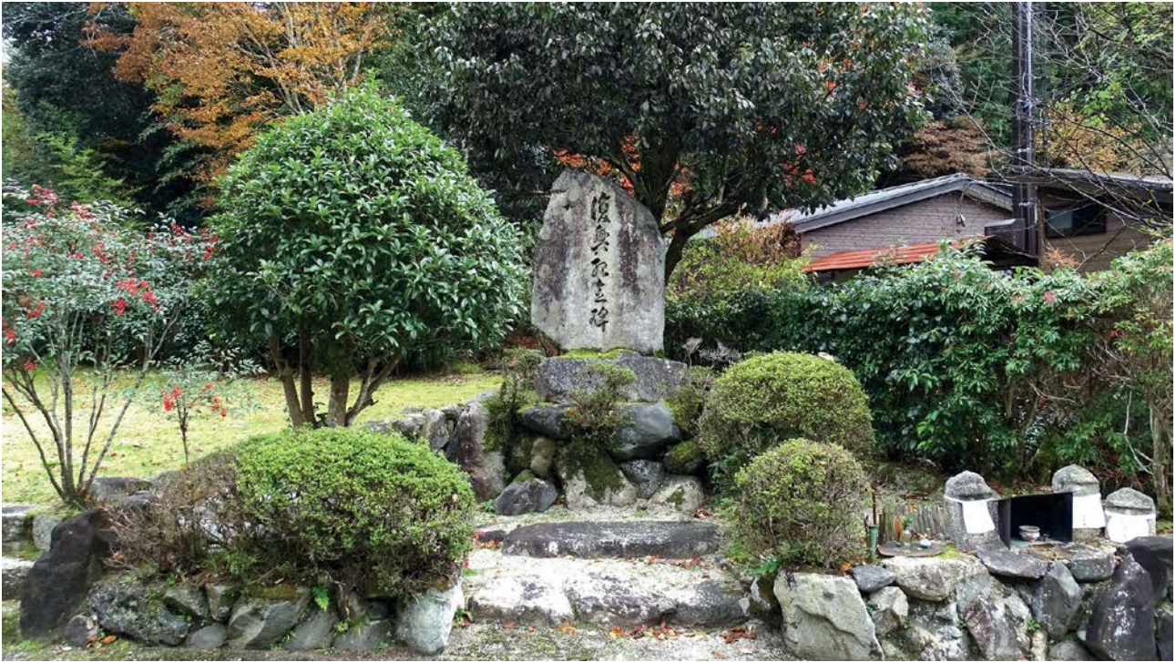
Figure 3 : Monument commémoratif de l'inondation de 1935 dans le village de Nakamachi (au Japon), préfecture de Shiga.

mot « catastrophe ». Ici, la catastrophe a été surmontée, car perçue comme une opportunité de relancer la vie de la communauté selon un modèle dual associant de nouvelles composantes (travaux d'ingénierie écologique) à un cadre paysager et culturel familier hérité du passé.