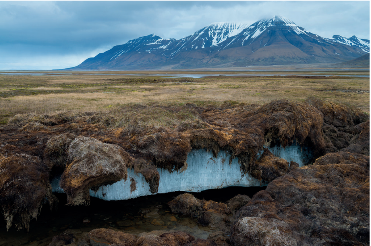
Fonte du permafrost au Spitzberg, près de Longyearbyen (capitale administrative de l'archipel du Svalbard au nord de la Norvège).

« Il n'est désormais pas un seul lieu sur Terre, où l'on ne puisse constater de visu les effets du changement climatique. »