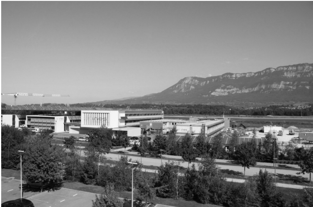
Photo 2 : L'Institut National de l'énergie solaire à Chambéry (INES) : un partenariat entre la recherche, l'enseignement, les collectivités locales et l'industrie.

✓ enfin, INES Education, qui a des missions d'information et de promotion, de formation continue, de veille et d'analyse, ainsi que d'expertise (notamment en matière de métrologie).