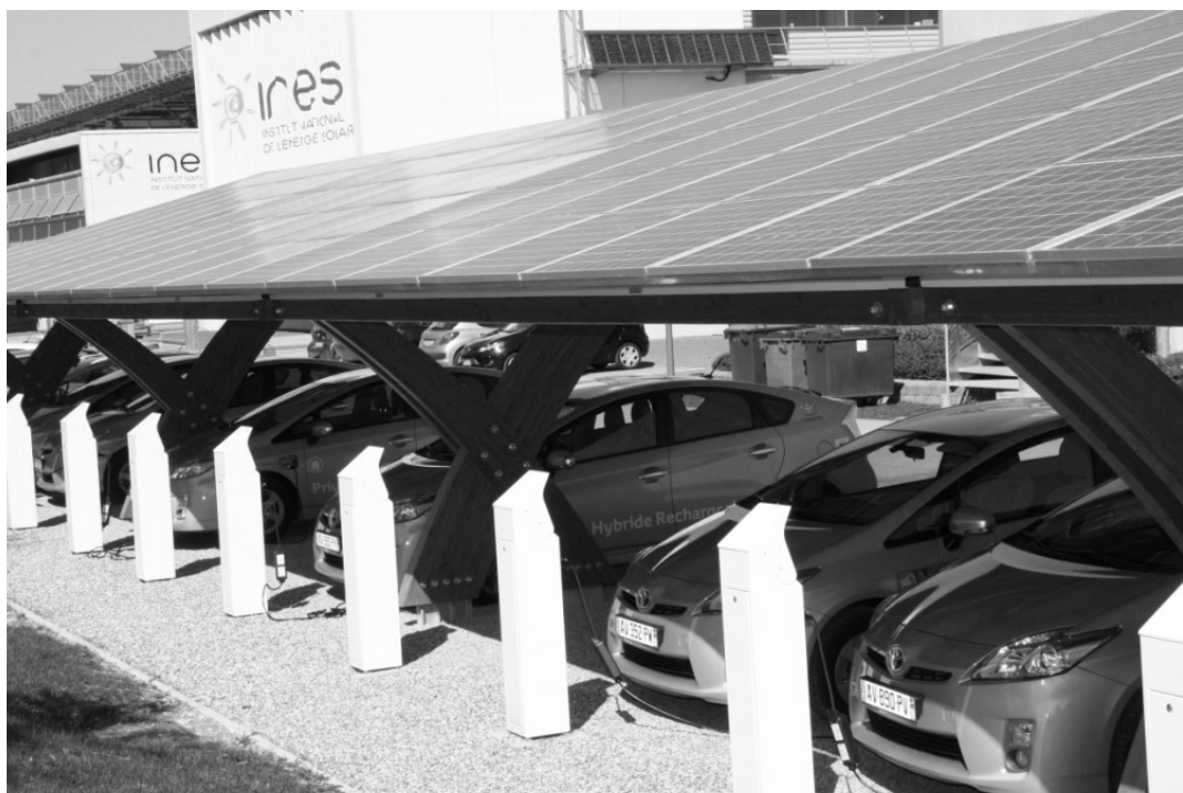
Photo 1 : Illustration de la convergence entre habitat et transport : expérimentation à l'INES de la recharge de véhicules hybrides par des toits solaires photovoltaïques.

recherche fondamentale, d'amélioration continue des technologies existantes en développant de nouveaux matériaux et composants, mais ils intègrent désormais les technologies dans des systèmes de plus en plus complexes, jusqu'aux usages finaux, c'est-à-dire jusqu'à l'interaction avec les clients des entreprises bénéficiant de leurs travaux.