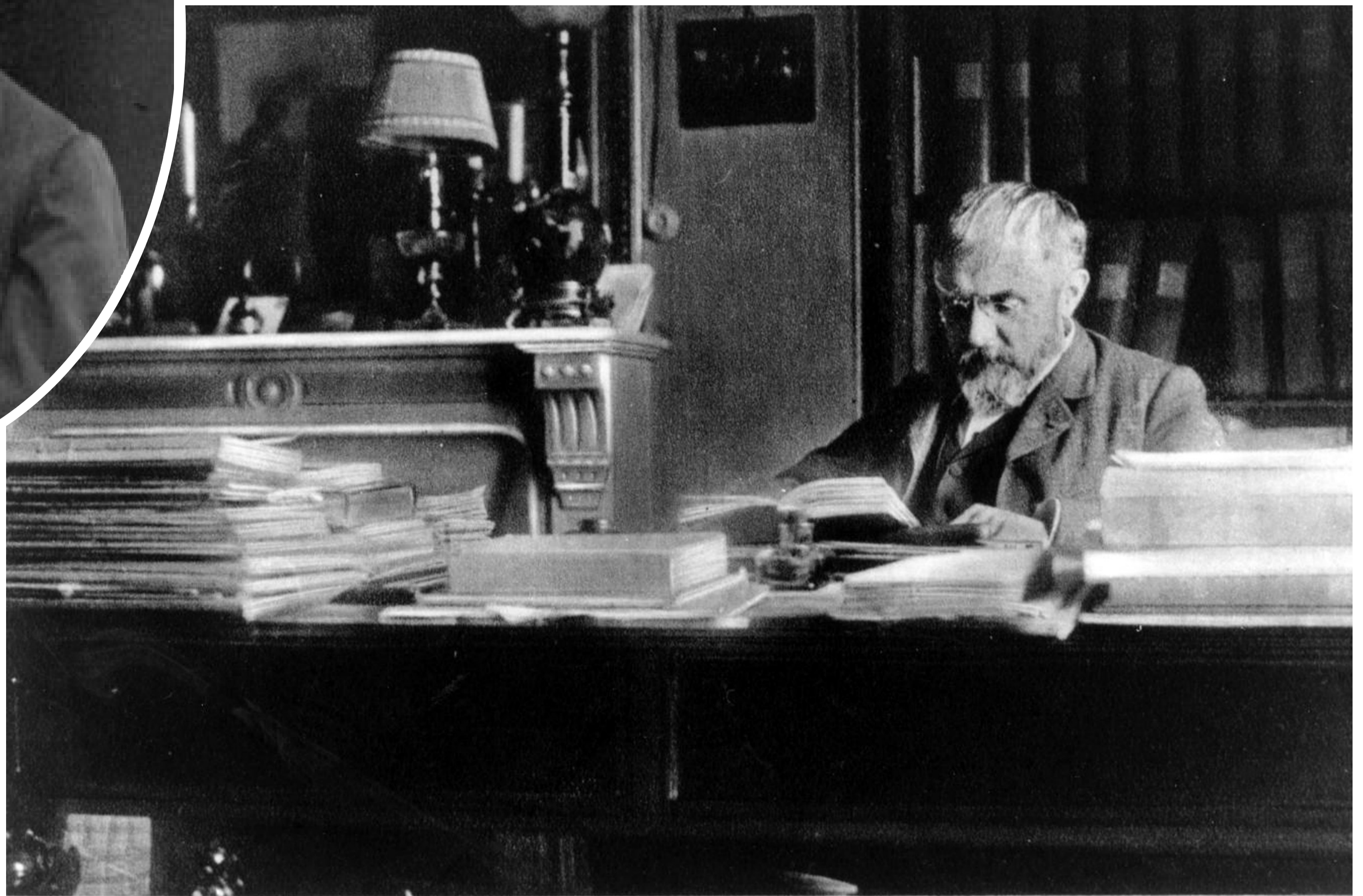
HENRI POINCARÉ DANS SON CABINET DE TRAVAIL.

“ Parmi les combines que l'on choisira, les plus fécondes seront souvent celles qui sont formées d'éléments empruntés à des domaines très éloignés. ”